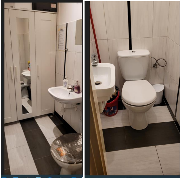
Kuchnia z balkonem