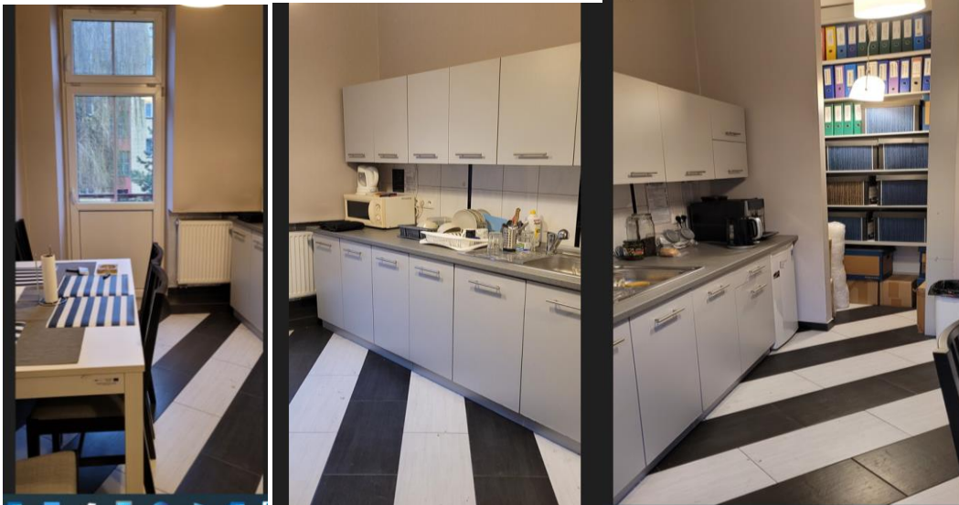
Pokój nr 2